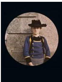
Bretagne - 1909